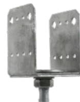
Pilarikengä PIK 90-140 mm

Säädettävä sivu- ja korkeussuunnassa. Esim. katosten puiset kannatintolpat.