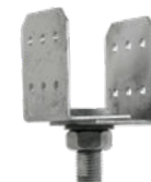
Pieni pilarikengä PIK 50 x 70 mm

Säädettävä sivu- ja korkeussuunnassa. Esim. katosten puiset kannatintolpat.