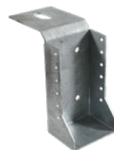
Palkkikengä PAK-100 x 200 mm

Piilokiinnike. Kevyemmän hirsirakennuksen pitkällä sivulla sisäpuoliseen kiinnitykseen. Terassirungon välilankkujen kiinnitykseen.