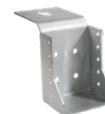
Palkkikengä PAK-100 x 150 mm

Välipohjarakenteen kannatinpalkki. Vaakasuntaisten puupalkkien kiinnitys seinään tai pilareihin.